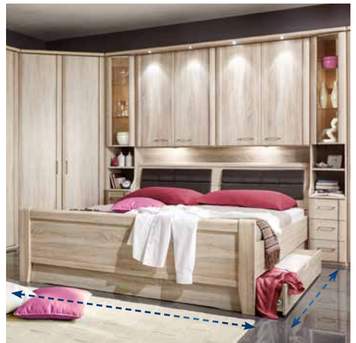
Aufbaubeispiel als Bettbrückenkombination.