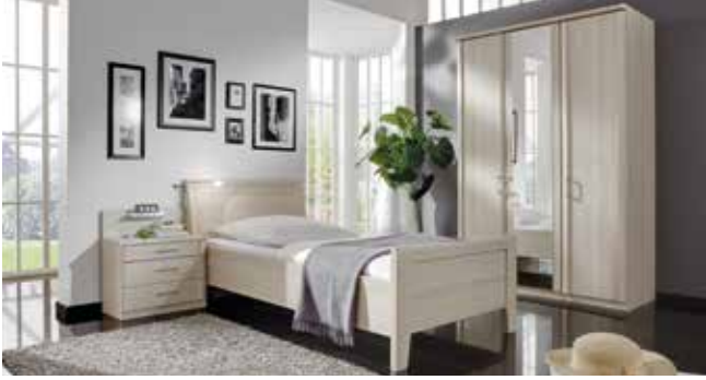
Komfortzimmer optional mit LED-Lampen erhältlich.

Ein Programm, viele Gesichter: EM 1080 passt sich völlig flexibel an Ihre Raumsituation und Ihre ganz persönlichen Vorlieben an. So entsteht Ihre einzigartige Traumkombi!