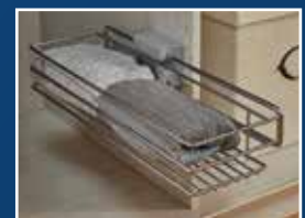
Der Utensilienauszug bietet cleveren Stauraum.