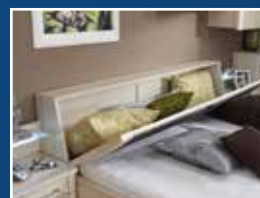
Stauraum im Kopfteil optional erhältlich.