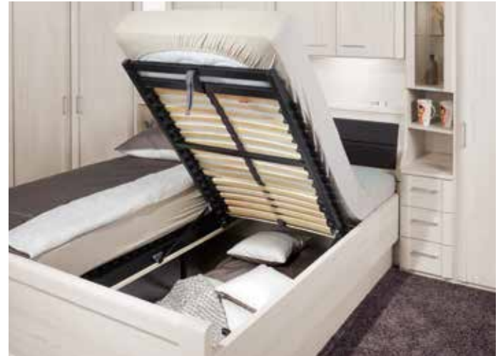
Praktischer Lattenrost mit Springauf-Beschlag.