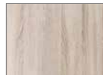
Eiche Sägerau Nachbildung