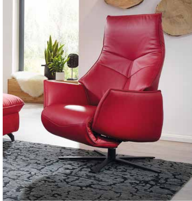
Funktionssessel , in strapazierfähigem Leder, motorisch mit Aufstehhilfe, BHT ca. 73 x 114 x 83 cm.