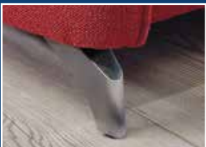
Edelstahl optik gebürstet.