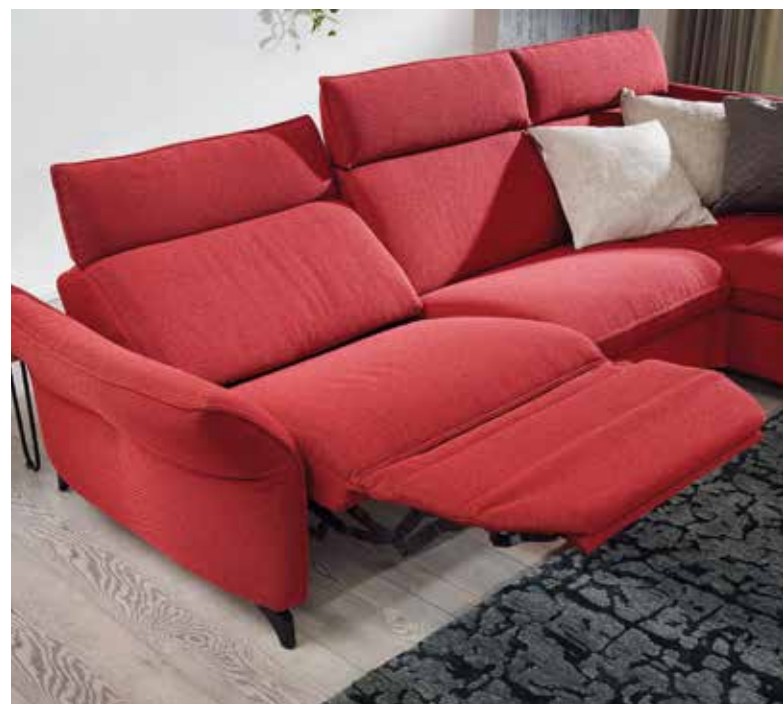
Wall-Free Funktion , manuell oder elektrisch.